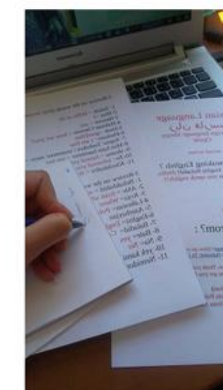
Persian Language and Literature Class