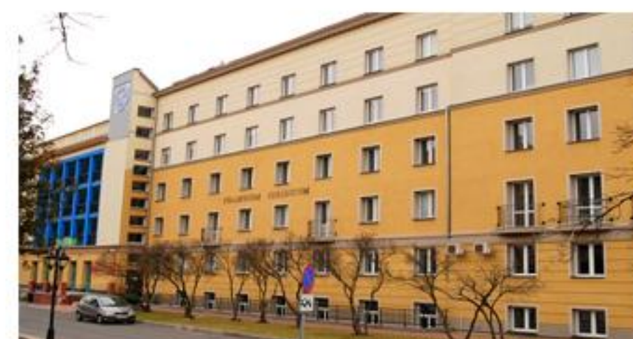
Faculty of Law

According to the agreement that was signed in 2016 between the University of Opole of Poland and the University of Mazandaran, 5 students were selected to study and participate in the program by the University of Mazandaran to study at Opole University. The following report will give a brief description of the University of Opole and the status of students that were sent there.