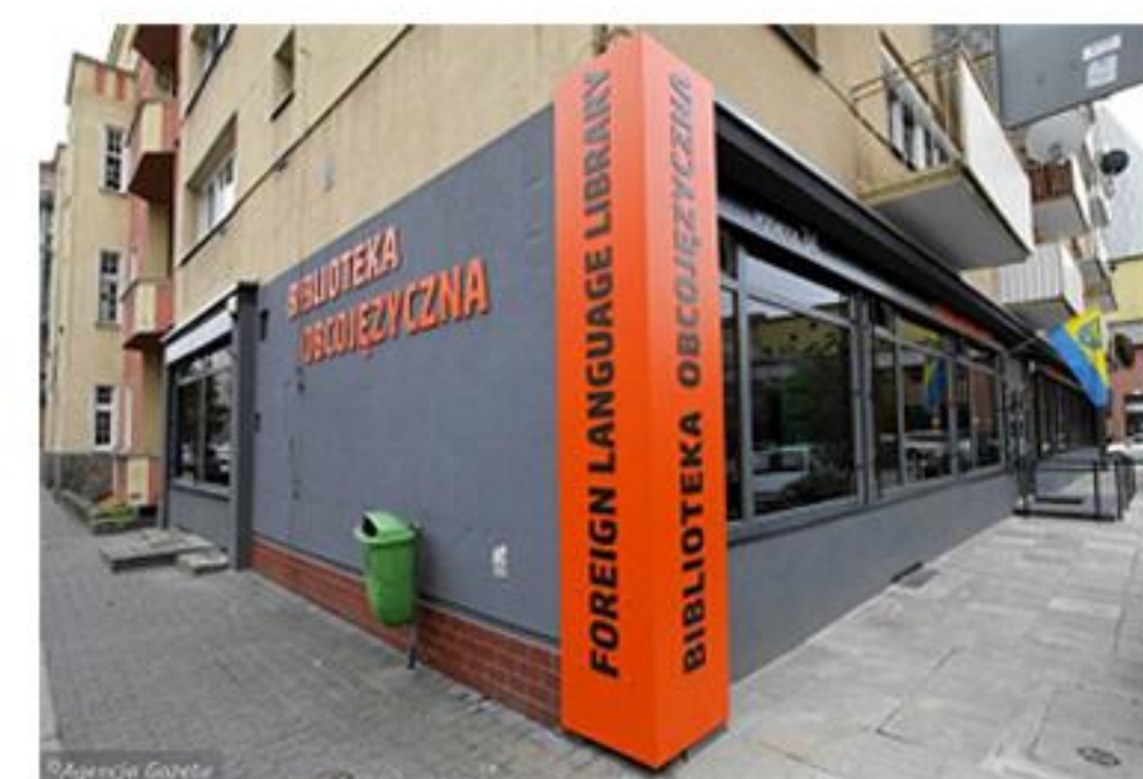
Foreign Languages Library