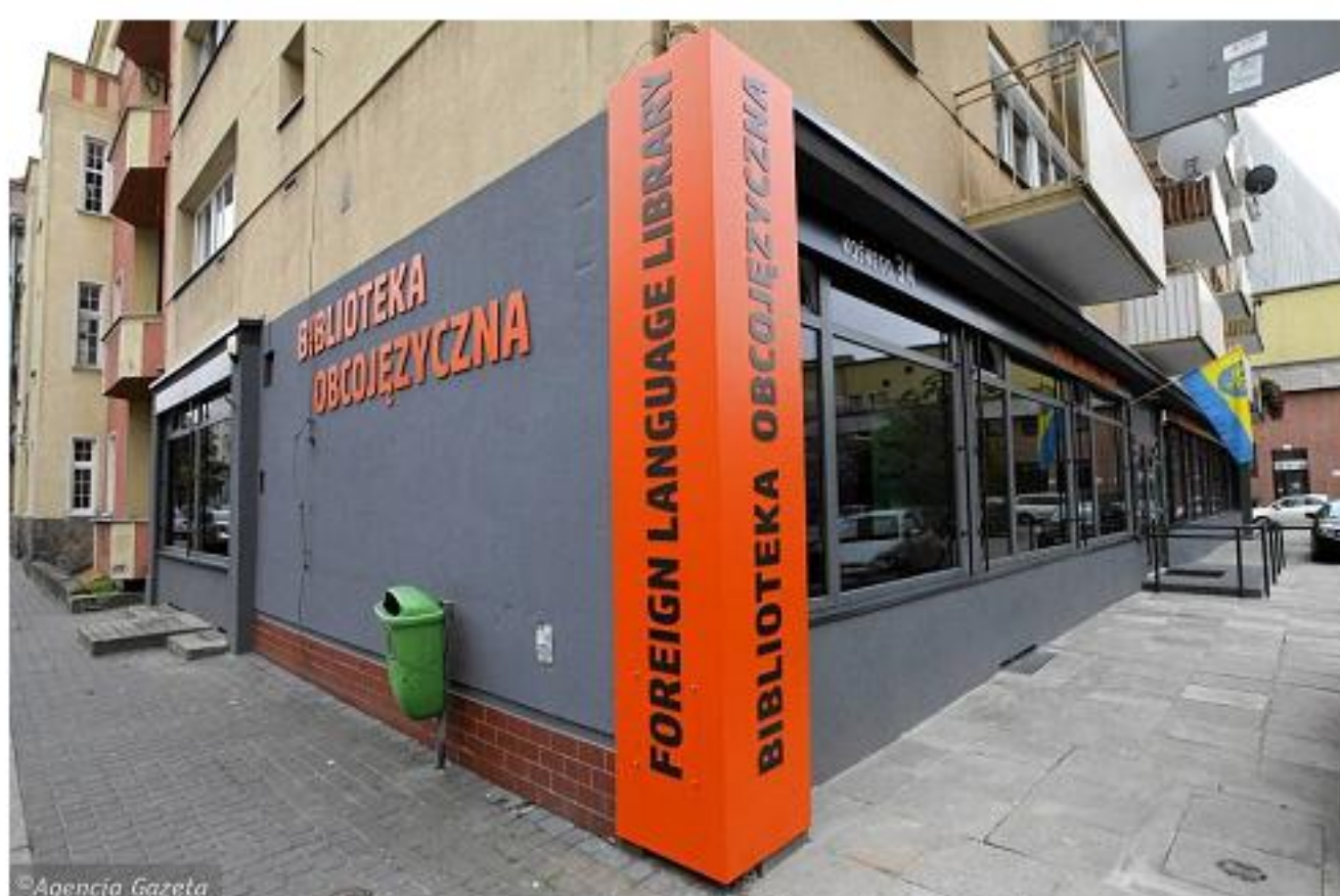
کتابخانه‌ی زبان‌های خارجی