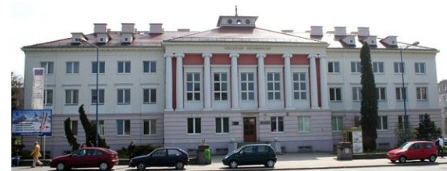
دانشکده اقتصاد دانشگاه اپوله