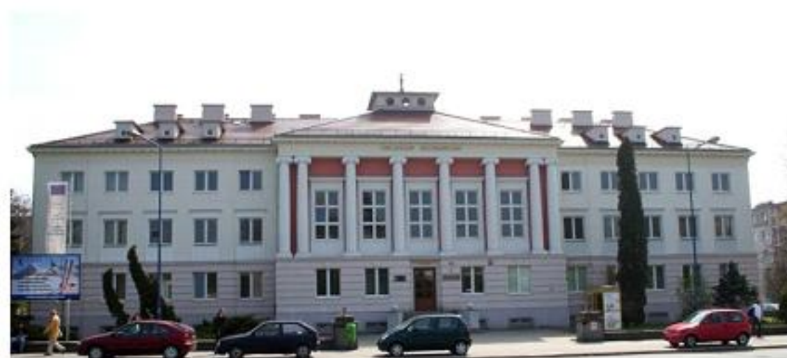
Faculty of Economics

( www.erasmusprogramme.com/the_erasmus.php )