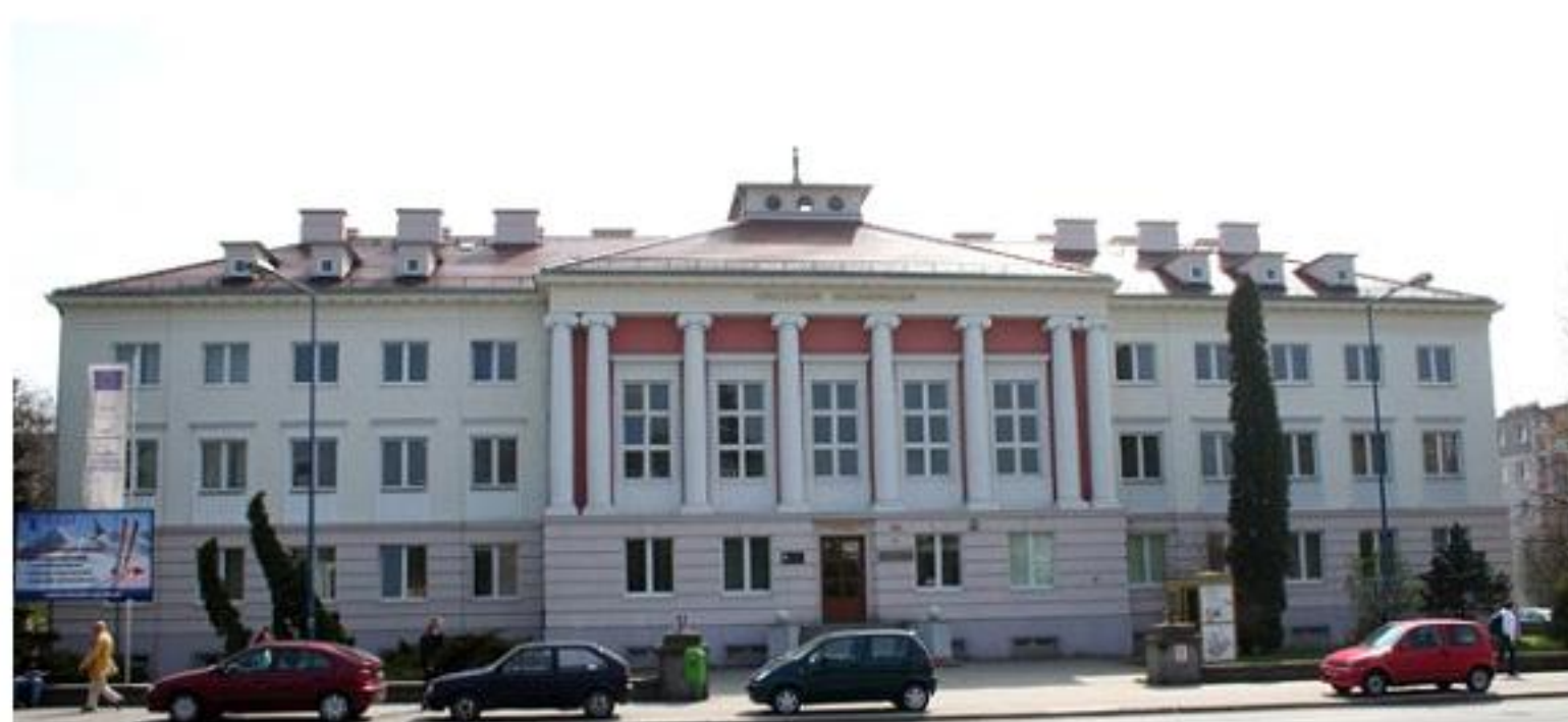
Faculty of Economics, University of Opole