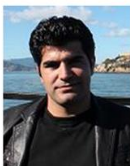
دکتر آقای، دانشکده علوم اقتصادی و اداری